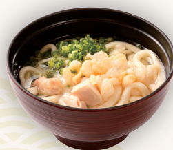
うどん単品 660円(税込)