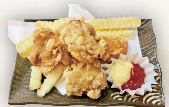
から揚げ&ポテトフライ 660円(税込)